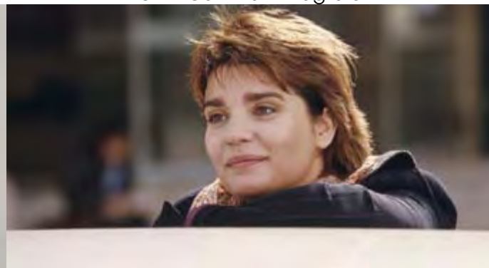
LES ENQUÊTES D'ÉLOÏSE ROME