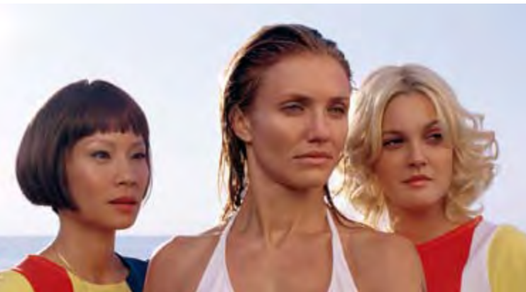
CHARLIE'S ANGELS 1 ET 2