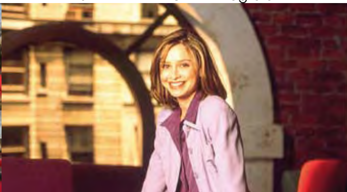
ALLY MC BEAL l'intégrale