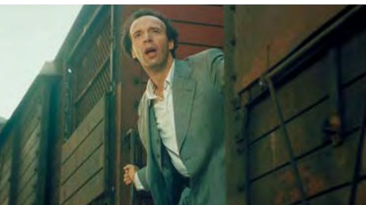
LA VIE EST BELLE