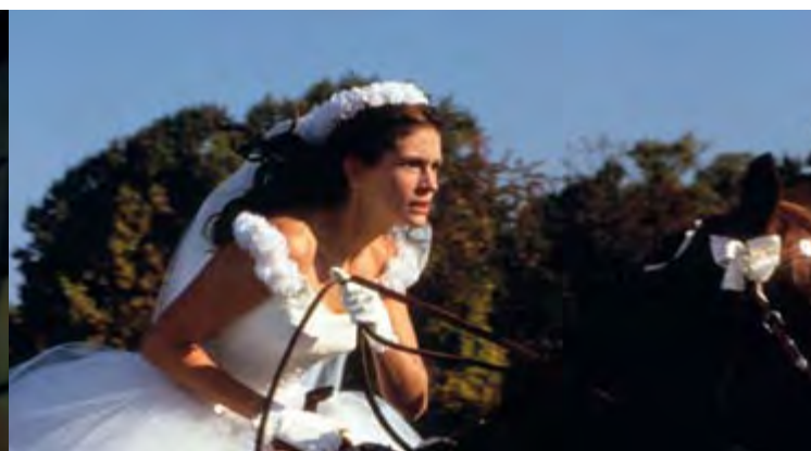
JUST MARRIED (OU PRESQUE)