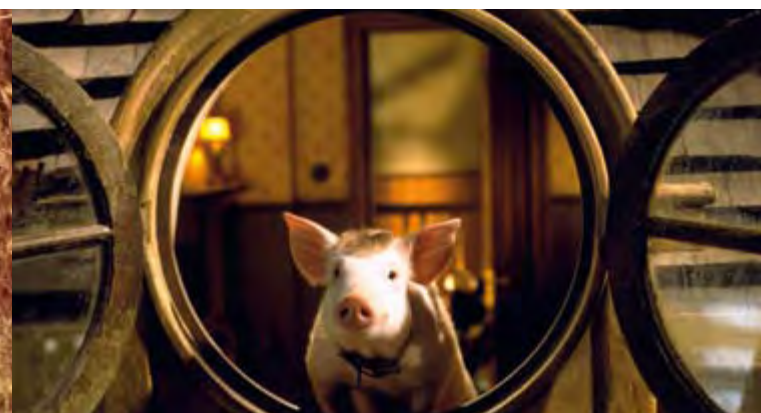
BABE, LE COCHON DEVENU BERGER ET BABE, LE COCHON DANS LA VILLE