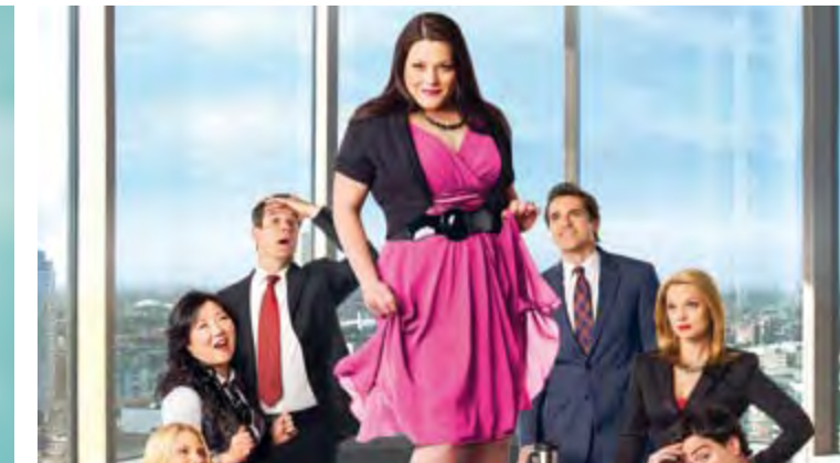
DROP DEAD DIVA SAISON 2