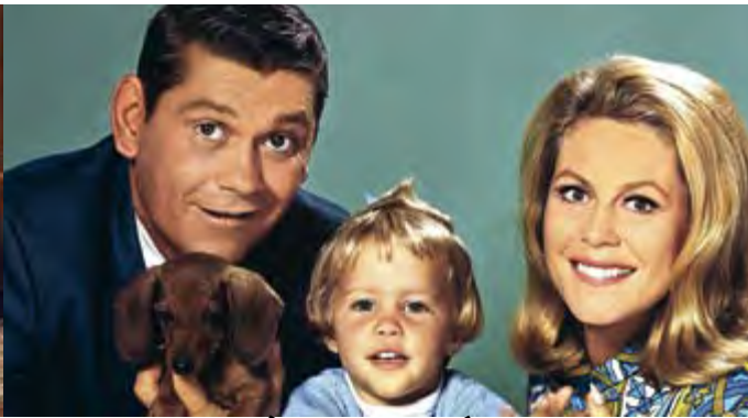
MA SORCIÈRE BIEN AIMÉE l'intégrale