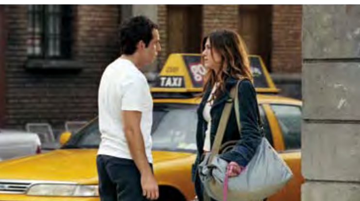
POLLY ET MOI