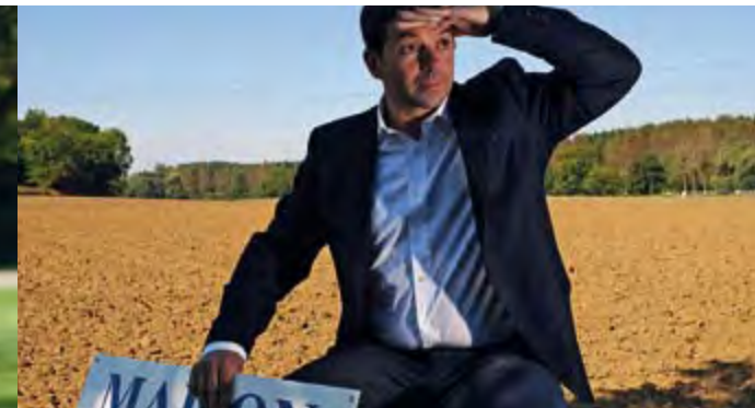
MAISON À VENDRE