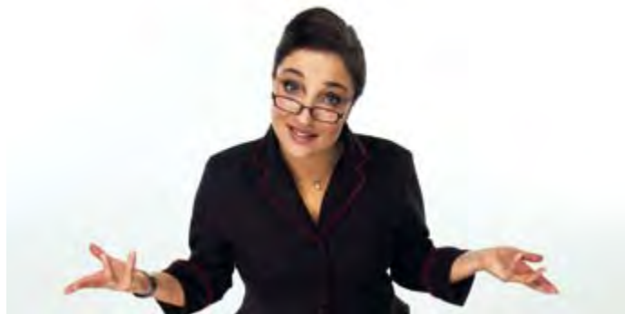
SUPER NANNY UK