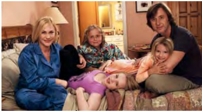
MÉDIUM SAISON 6