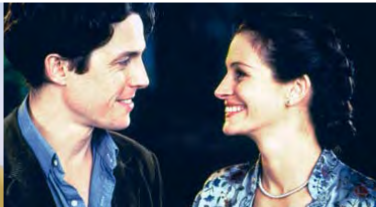
COUP DE Foudre À NOTTING HILL