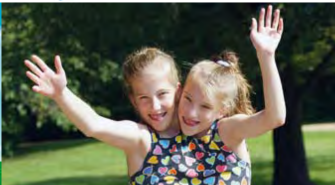
EXTRAORDINARY PEOPLE INÉDIT