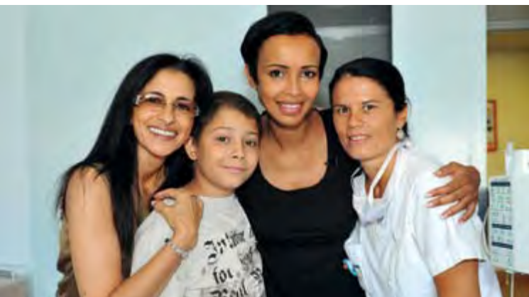
LES HÉROÏNES DU QUOTIDIEN