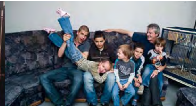
ON A ÉCHANGÉ NOS MAMANS INÉDIT