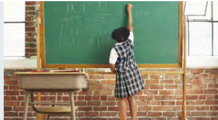
LIRE, ÉCRIRE, GRANDIR