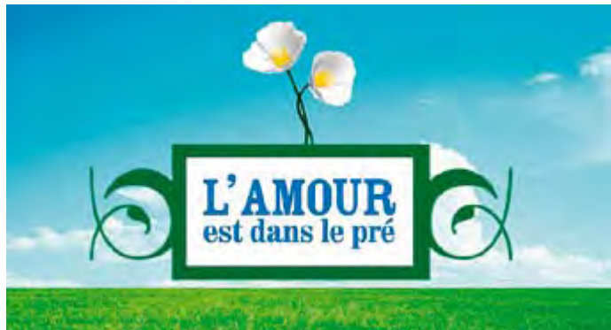
L'AMOUR EST DANS LE PRÉ PORTRAITS INÉDITS