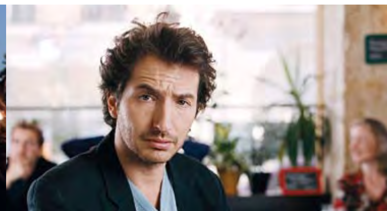
MENSONGES ET TRAHISONS ET PLUS SI AFFINITÉS...