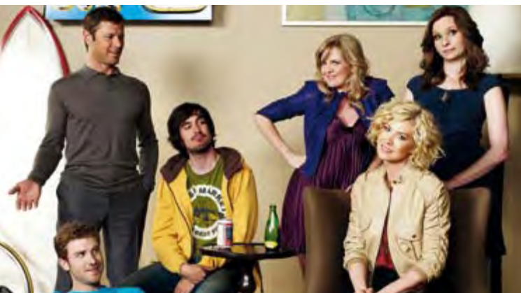
PARENTS PAR ACCIDENT