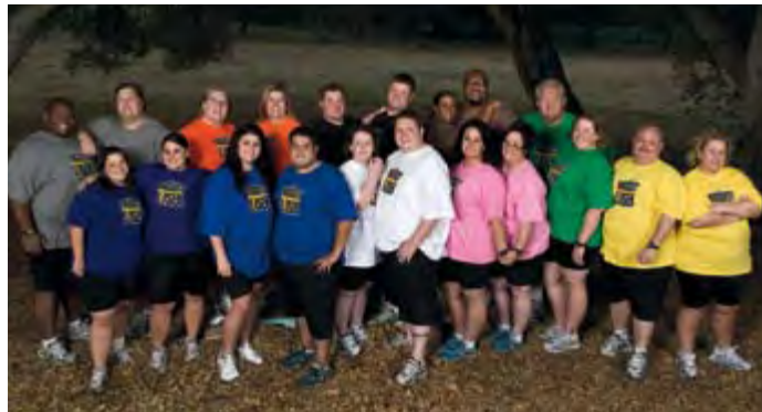
LE GRAND PERDANT SAISON 5 INÉDITE